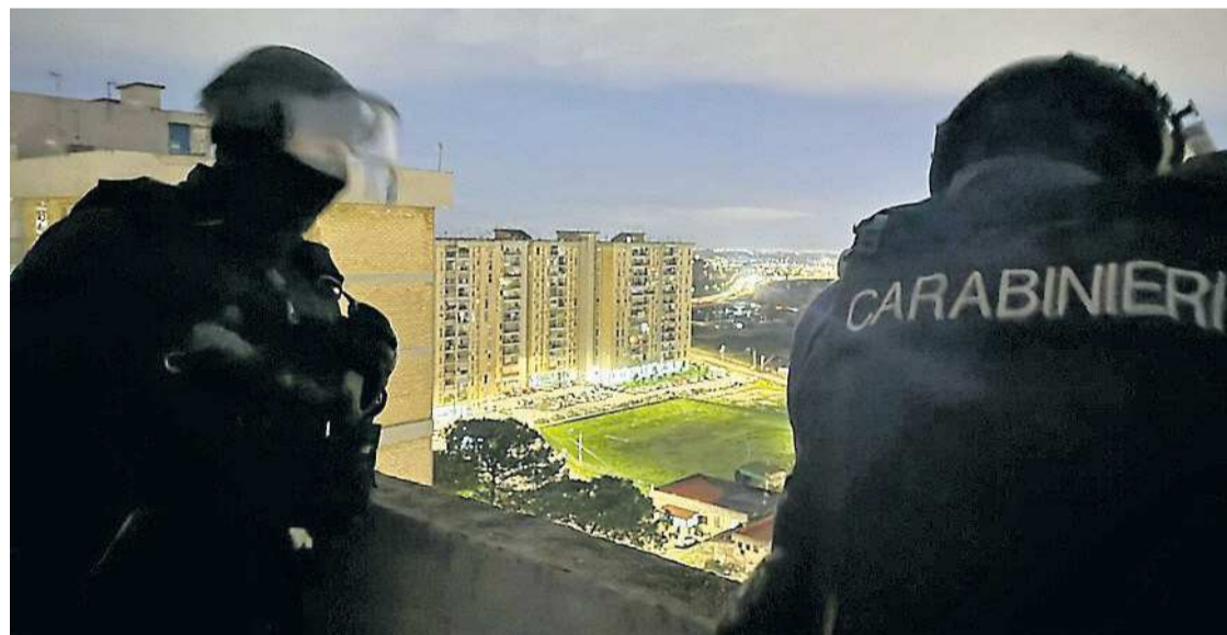
LE INDAGINI I carabinieri in azione nel quartiere dell'area nord: arrestati nove narcotrafficienti

UN UOMO UCCISO, TORTURATO E FILMATO «COSÌ È SCATTATA LA VENDETTA DEI CALABRESI SUI TRADITORI»