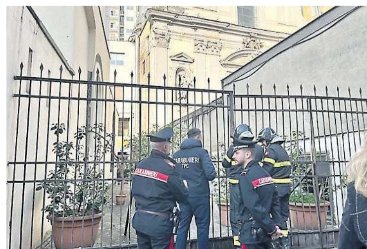
L'INTERVENTO I militari hanno sgomberato il magazzino abusivo

TAVOLI E SEDIE DI UNA TRATTORIA ACCATATA SENZA AUTORIZZAZIONE DENUNCIATO IL GESTORE DEL LOCALE